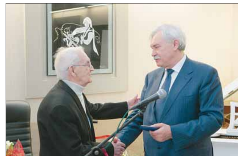
Георгий Полтавченко поздравляет Марка Тайманова с 90-летием и вручает поздравительную телеграмму от президента России Владимира Путина и знак отличия «За заслуги перед Санкт-Петербургом». 7 февраля 2016 г.

Марк Евгеньевич был и талантливым пианистом, лауреатом международных конкурсов, многие годы вел активную концертную деятельность. Записанный им альбом был издан в серии «Великие пианисты XX столетия». Перу Марка Тайманова принадлежат интерес-