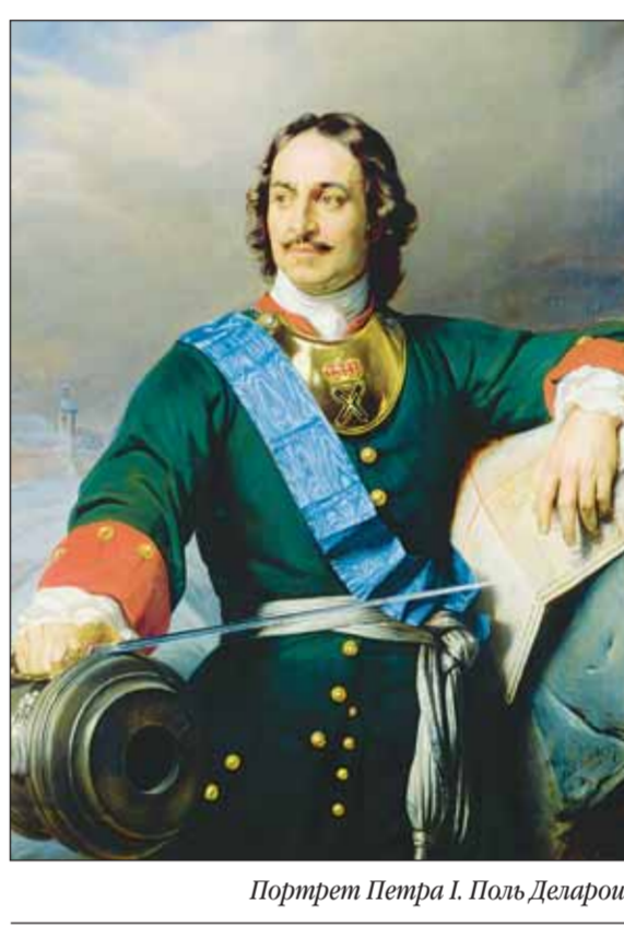
Портрет Петра I. Пётр Деларуш

Наибольшую известность таинственное «Завещание» получило только спустя 24 года, когда были опубликованы все 14 пунктов упо-