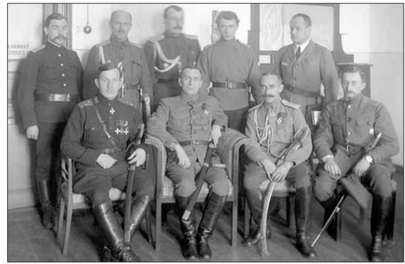
Сотрудники штаба Сибирской армии. Александр Колчак второй слева в переднем ряду. Екатеринбург, 1919 г.

Скорее всего, судебное разбирательство в Петербурге снова поднимет тему Колчака, споры и раздоры вокруг имени которого не утихают уже более 15 лет. Как ни крути, а фигура предводителя белого движения неоднозначна.