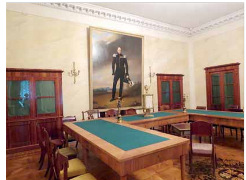
Комендантский дом Петропавловской крепости. Парадный зал, где оглашали приговор суда декабристам

Музей декабристов в Петербурге по разным причинам так и не появился. Но уже почти 30 лет при Государственном музее исто-