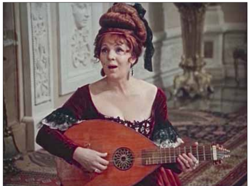
В роли Анарды в фильме Яна Фрида «Собака на сене». 1977 г.