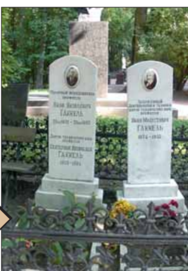
Захоронение Я.Я. и Я.М. Гаккелей