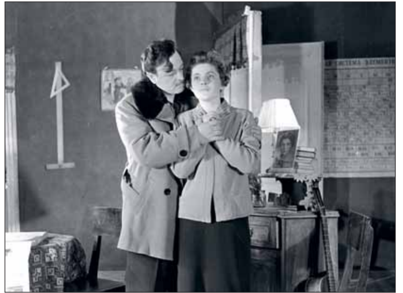
Сцена из спектакля Георгия Товстоногова по пьесе Александра Володина «Пять вечеров». БДТ. 1959 г.