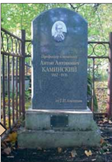
Захоронение А.А. Каминского