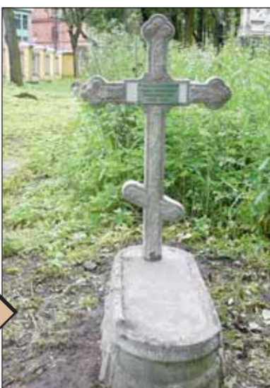
Захоронение Б.Л. Мультиановского