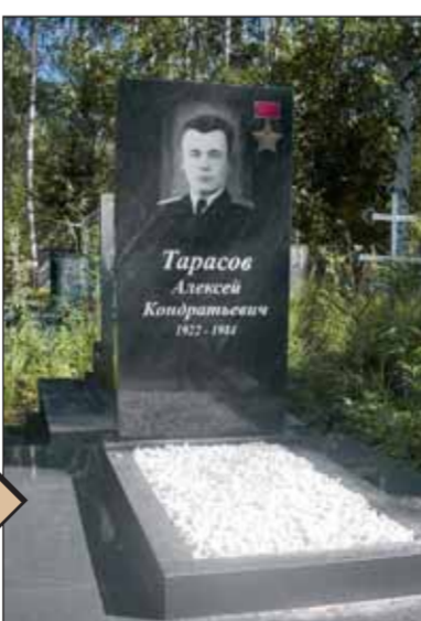
Захоронение А.К. Тарасова