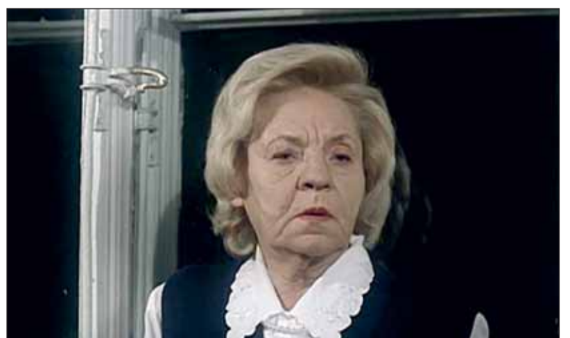
В фильме Виталия Мельникова «Лунной был полон сад». 2001 г.