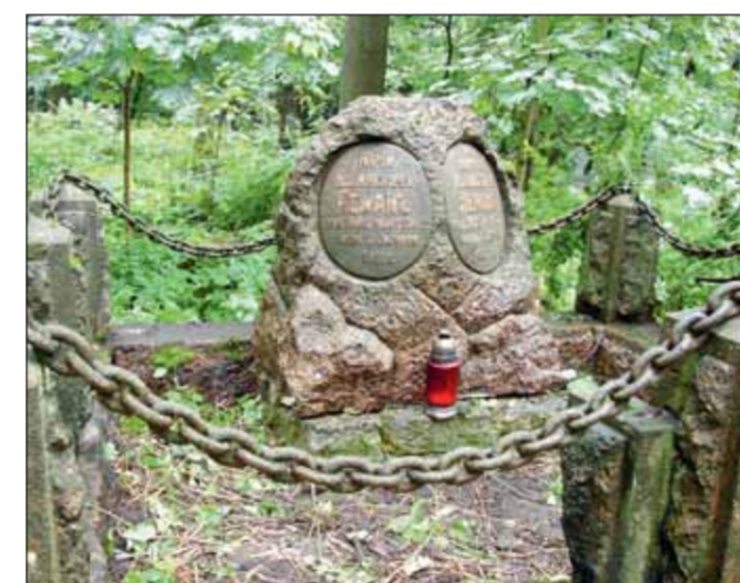
Захоронение Ю.Я. Лемана на Смоленском православном кладбище

С конца 1870-х приобрел известность своими женскими портретами, головками и полуфигурами молодых дам из великосветских кругов Парижа. Многие из таких произведений Юрия Лемана появлялись на выставках Товарищества передвижных художественных выставок, членом которого