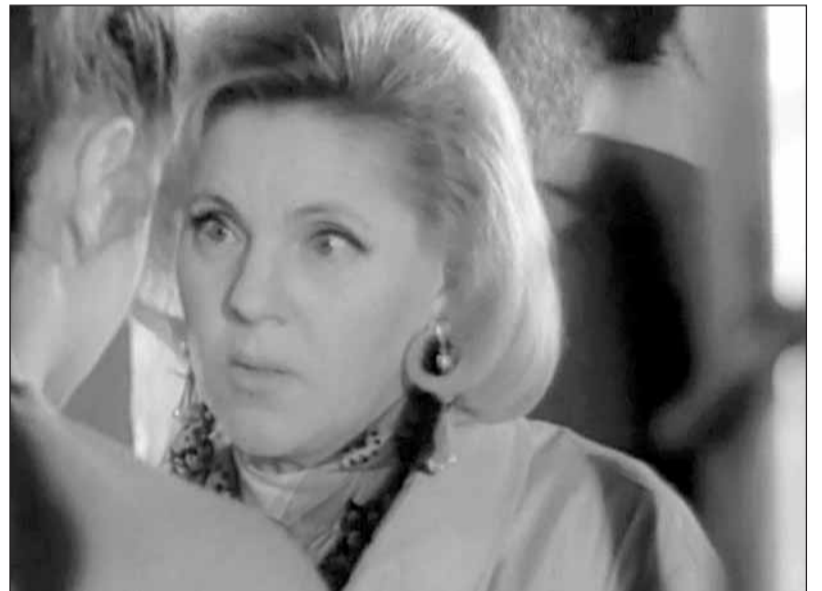
В фильме Киры Муратовой «Долгие проводы». 1971 г.