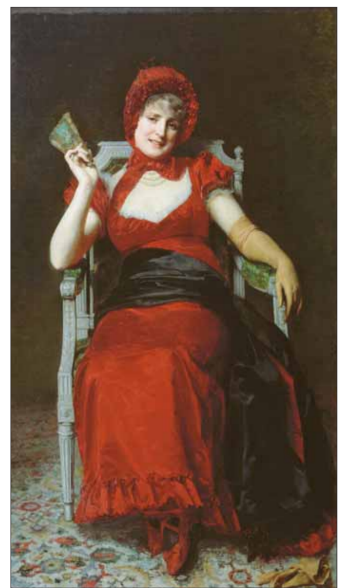
Ю.Я. Леман. «Дама в костюме времен Директории». 1881 г. Государственная Третьяковская галерея

Помимо Франции во второй половине 1870-х годов в