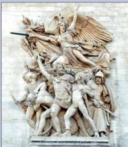
Скульптурная группа «Марсельеза»

На стенах арки выгравированы названия 128 сражений, выигранных республиканской и императорской армиями, а также имена 558 французских военачальников.