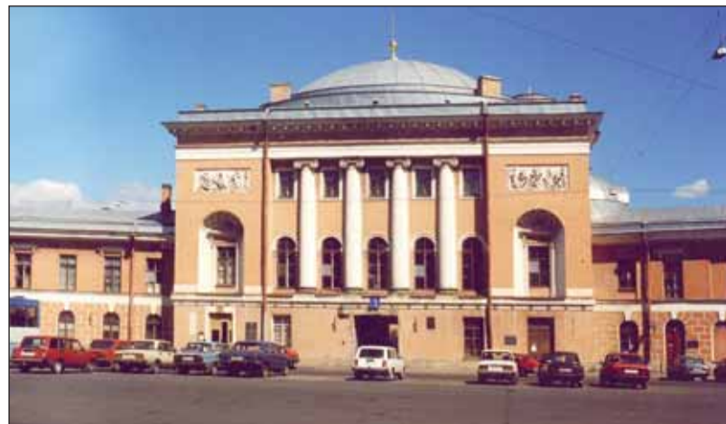
Конюшенная площадь, церковь Спаса Нерукотворного образа

И выбор его последней квартиры в доме №12 был далеко не случаен. Как известно, выпускник Царскосельского лицея Александр Сергеевич Пушкин 9 июня 1817 года получил назначение в Коллегию иностранных дел на должность переводчика в звании коллеж-