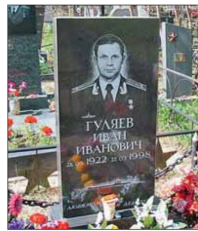
Захоронение И.И. Гуляева

Не сохранились к настоящему времени захоронения Бялокуза Евгения Льдовича (1861—1919), военного гидрографа, генерал-лейтенанта Корпуса гидрографов, первого советского начальника Главного гидрографического управления, и Шиллинга Николая Густавовича (1828—1910/1911), военного моряка, адмирала, ученого, предска-