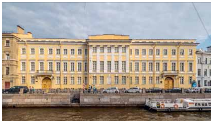
Набережная Мойки, 12

Самым первым петербургским адресом поэта была гостиница «Бордо», которая находилась в до-