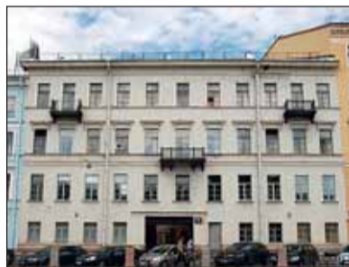
Набережная Мойки, 13