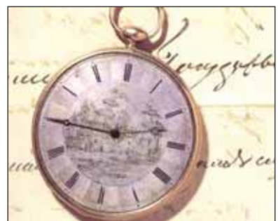
Золотые часы были получены А.С. Пушкиным от вдовствующей императрицы Марии Федоровны в 1816 г. в качестве награды за написанные им стихи по случаю бракосочетания великой княжны Анны Павловны и принца Оранского. Часы были у А.С. Пушкина, когда он направлялся к месту дуэли. Их остановил в минуту смерти поэта В.А. Жуковский