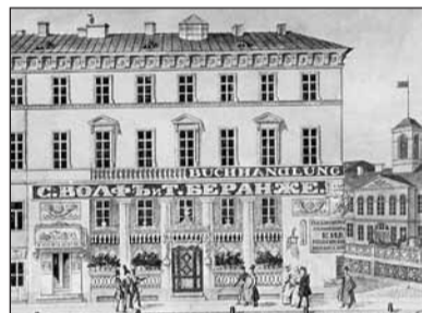
Кондитерская С. Вольфа и Т. Беранже на углу Невского проспекта и набережной Мойки. Литография 1830-х годов

ко от нас. Мы положили часто видаться...» — писал Пущин в своих «Записках о Пушкине». В доме Пущина на Мойке бывшие лиценсты отмечали 19 октября 1818 года вторую лицейскую годовщину.