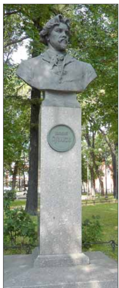
Бюст Василия Ивановича Сурикова в Румянцевском саду в Санкт-Петербурге