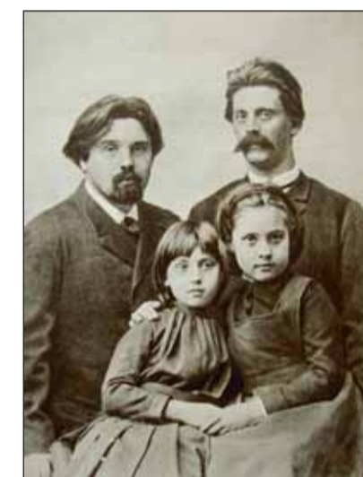
Василий Суриков с братом Александром и дочерью Ольгой (справа) и Еленой. 1889 г.

Интересно, что в селе Ладейском игра «Взятие снежного городка» в традиционном виде, который и отразил в своей картине художник, существовала до 1922 года.