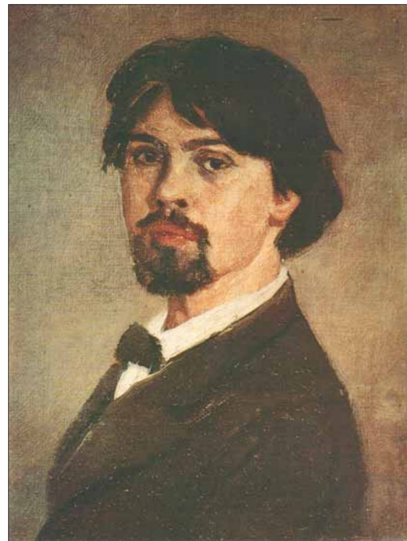
Василий Суриков. Автопортрет. 1879. Третьяковская галерея

Во время учебы за свои работы Суриков получил четыре серебряных медали и несколько денежных премий. Большое внимание худож-