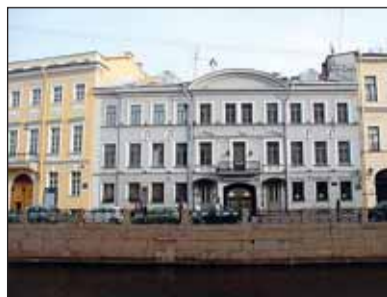
Набережная Мойки, 14

С Иваном Ивановичем Пушковым, жившим в соседнем доме №14, Александр Сергеевич Пушкин познакомился на лицейском экзамене 12 августа 1811 года. «...Не припомню, кто — только чуть ли не В.Л. Пушкин, привезший Александра, подозвал меня и познакомил с племянником. Я узнал от него, что он живет на Мойке, недале-