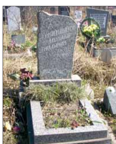
Захоронение А.А. Красильщикова

на на карте Арктики» (СПб, 2009, изд. ВНИИОкеангеология) и «Арктический некрополь» (СПб, 2014, изд. «Посейдон»).