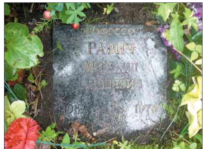
Захоронение М.Г. Равича