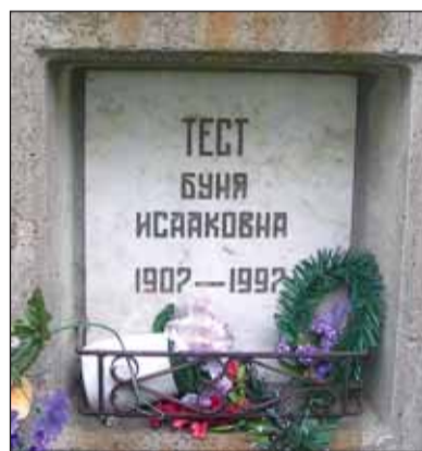
Захоронение Б.И. Теста