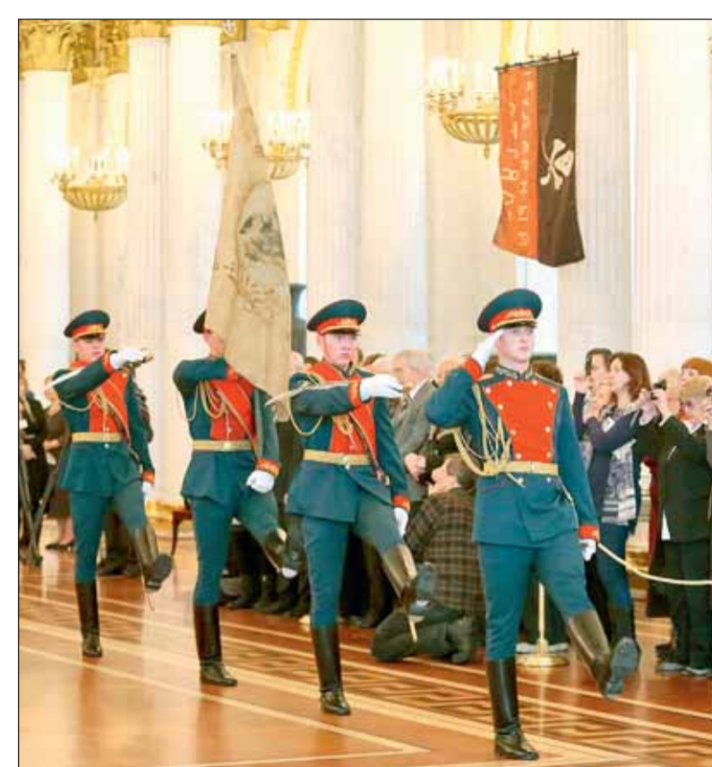
Торжественный вынос Георгиевских знамен, посвященный Дню героев Отечества, в Государственном Эрмитаже

Среди удостоенных звания Героя Советского Союза в годы Великой Отечественной войны были представители всех родов и видов войск в званиях от рядового до маршала, представители всех национальностей огромной страны. Всего получивших это звание за