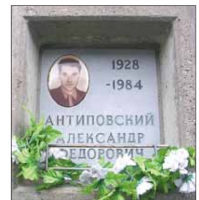
Захоронение А.Ф. Антиповского

на на карте Арктики» (СПб, 2009, изд. ВНИИОкеангеология) и «Арктический некрополь» (СПб, 2014, изд. «Посейдон»).