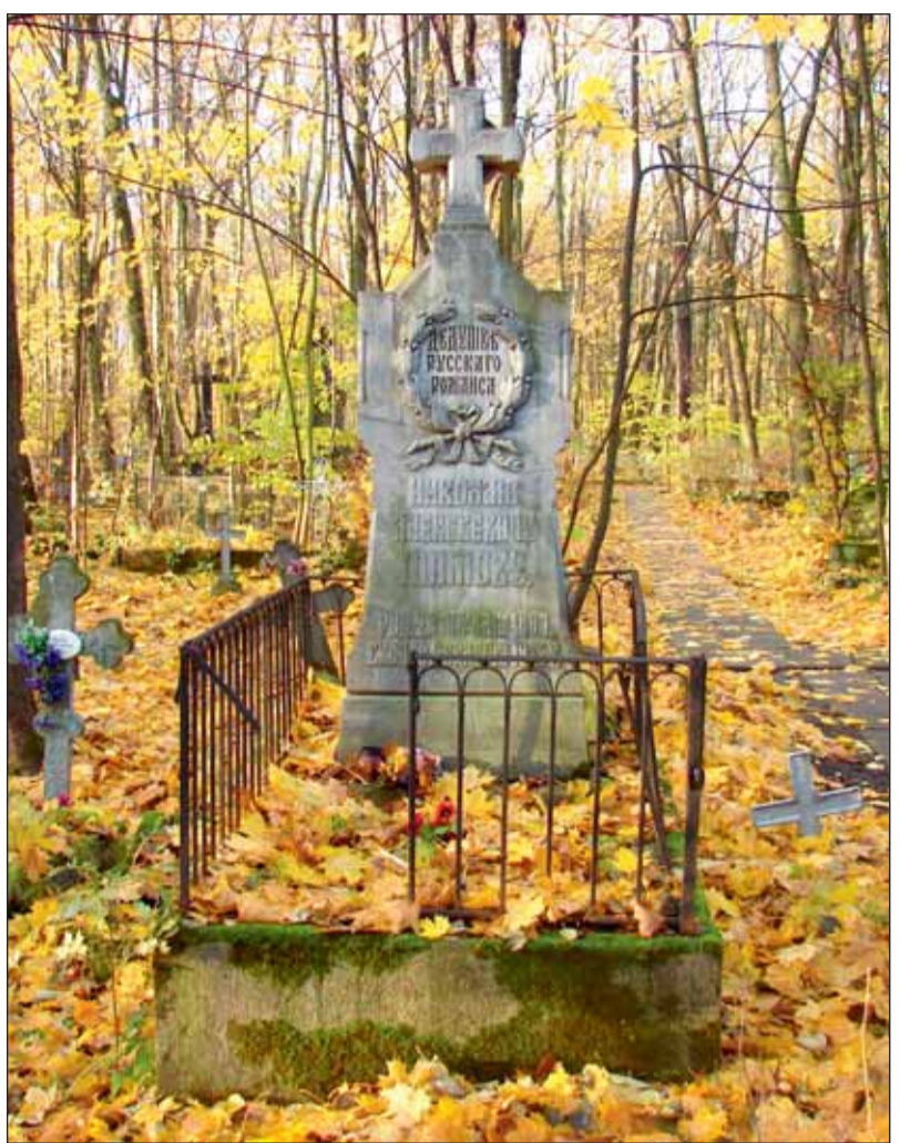
Захоронение Н.А. Титова