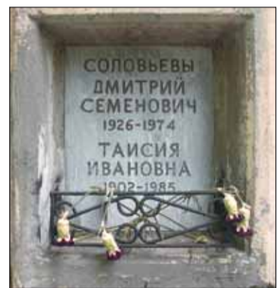
Захоронение Д.С. Соловьева