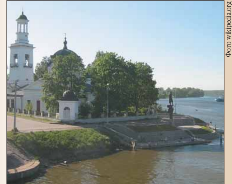
Церковь Александра Невского в Усть-Ижоре

Невская битва — сражение между русскими и шведскими войсками на реке Неве. Целью вторжения шведов был захват устья реки Невы, что давало возможность овладеть важнейшим участком пути «из варяг в греки», находившимся под контролем Великого Новгорода. Воспользовавшись туманом, русские неожиданно напали на шведский лагерь и разгромили врага; только наступление темноты прекратило битву и позволило спастись остаткам шведского войска Биргера, который был ранен Александром Ярославичем. Военно-политическое значение Невской битвы состояло в предотвращении угрозы вражеского нашествия с севера и в обеспечении безопасности границ России со стороны Швеции в условиях Батыева нашествия.