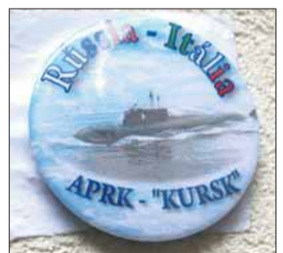
Знак, выпущенный к поезду в Италию

слоем краски остатки граффити были видны. Но наши итальянские друзья русского происхождения успокоили: через пару кварталов от учебного заведения на стенах домов граффити о подлодке сохранились — торговцы местных лавочек просто не дали их убрать», — вспоминает София Дудко. Там же, в Италии, выяснилось, что еще в 2000 году, сразу после гибели подлодки, итальянская поэтесса Анна Мария Бракале написала книгу «Потопление "Курска"», и только 12 лет спустя о ней стало