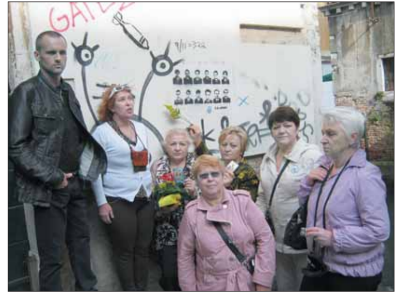
Около граффити, посвященного «Курску», в Венеции. 2012 г.