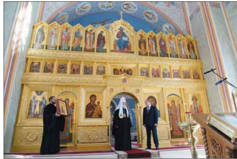
Владимир Путин и Патриарх Московский и всея Руси Кирилл в храме святого равноапостольного великого князя Владимира в Московском епархиальном доме

«Владимир Путин отметил огромное значение Московского епархиального дома для истории и культуры России и поблагодарил Патриарха Московского и всея Руси Кирилла за деятельное участие в его восстановлении», — сообщает пресс-служба главы государства.