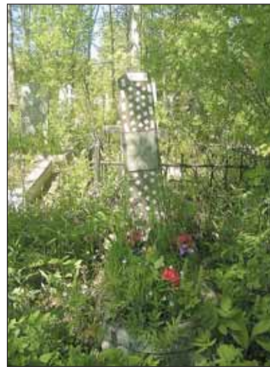
Захоронение А.П. Македонского