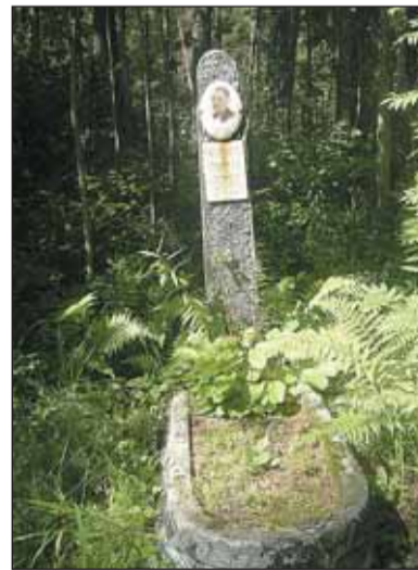
Захоронение Н.П. Мальцева