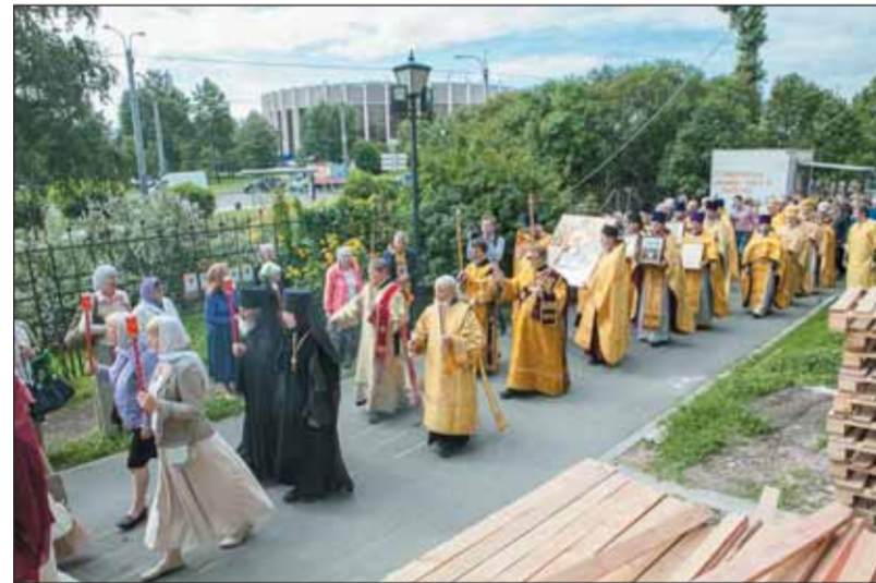
Празднования в Князь-Владимирском соборе в Петербурге