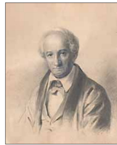
Максим Никифорович Воробьев

160 лет назад, 30 августа (11 сентября) 1855 года, в Санкт-Петербурге скончался русский художник-пейзажист Максим Никифорович Воробьев. Он был похоронен на Смоленском православном кладбище, а в 1936 году его прах был перенесен в Некрополь мастеров искусств Александровской лавры.