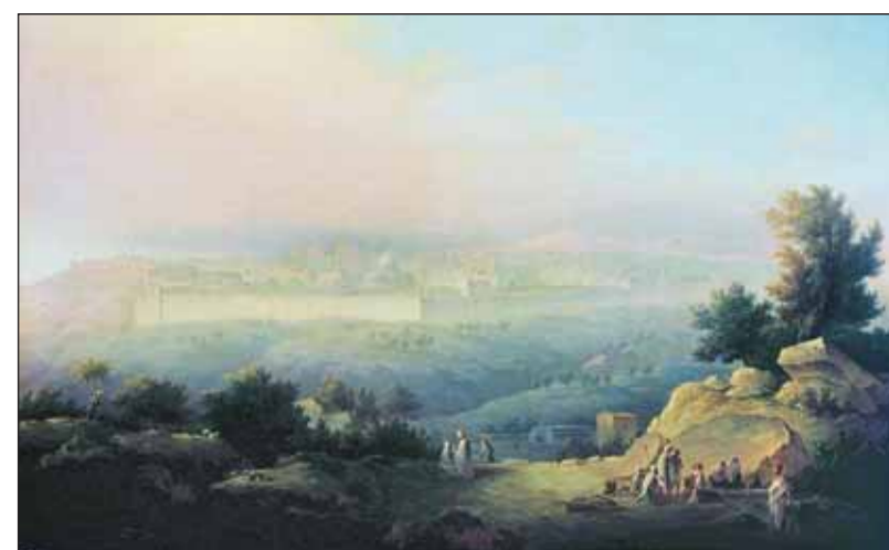
«Вид Иерусалима». 1821 г.

Через 16 лет после палестинского путешествия появились картины «Общий вид Иерусалима», а также «Вид Константинополя с