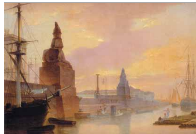
«Набережная Невы у Академии художеств». 1835 г.

в Палестину — виды острова Родос, городов Константинополя, Смирны, Яффы и других. Все это стало материалом для будущих картин: 90 листов акварельных рисунков, частью эскизов, частью оконченных. Путешествие Воробьева к святым местам было удостоено великим князем Николаем Павловичем для обустройства храма Воскресения Христова в подмосковном Новом Иерусалиме.