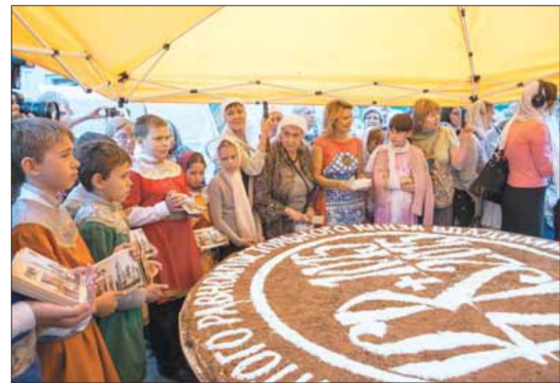
Ярмарка у Князь-Владимирского собора