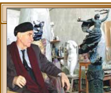
Михаил Константинович АНИКУШИН

Скульптор, народный художник СССР, Герой социалистического труда, лауреат Ленинской премии, награжден медалью «За оборону Ленинграда» и орденом Отечественной войны II степени. Родился 2 октября 1917 года в многодетной семье рабочего-паркетчика. В 1931 году начал заниматься в скульптурной студи-