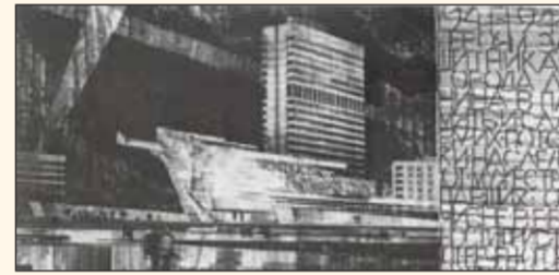
Конкурсный проект монумента Победы. Всесоюзный конкурс. 1966 г.