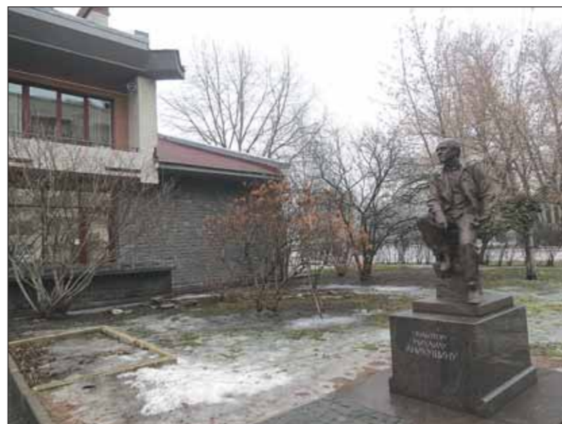
Филиал Государственного музея городской скульптуры «Мастерская Аникушина» находится на Петроградской стороне по адресу: Вяземский переулок, д. 8. Время работы: с 12.00 до 18.00. Касса закрывается в 17.00. Выходные дни: понедельник, вторник

Практически с каждой композицией связаны личные переживания автора, помогавшие рождению целых сюжетов. Та же «Блокада» — своего рода монолог скульптора, где в аллегорической форме отражены воспоминания о двух событиях — рассказ жены о жизни