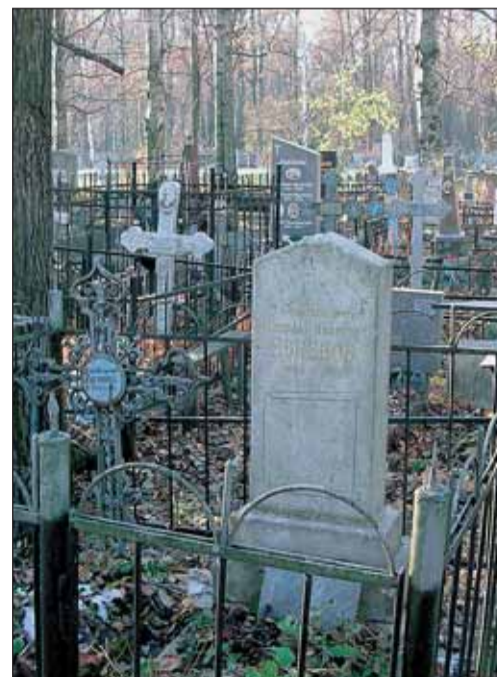
Захоронение Н.И. Евгенова