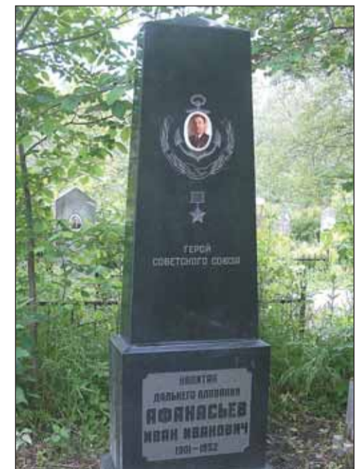
Захоронение И.И. Афанасьева