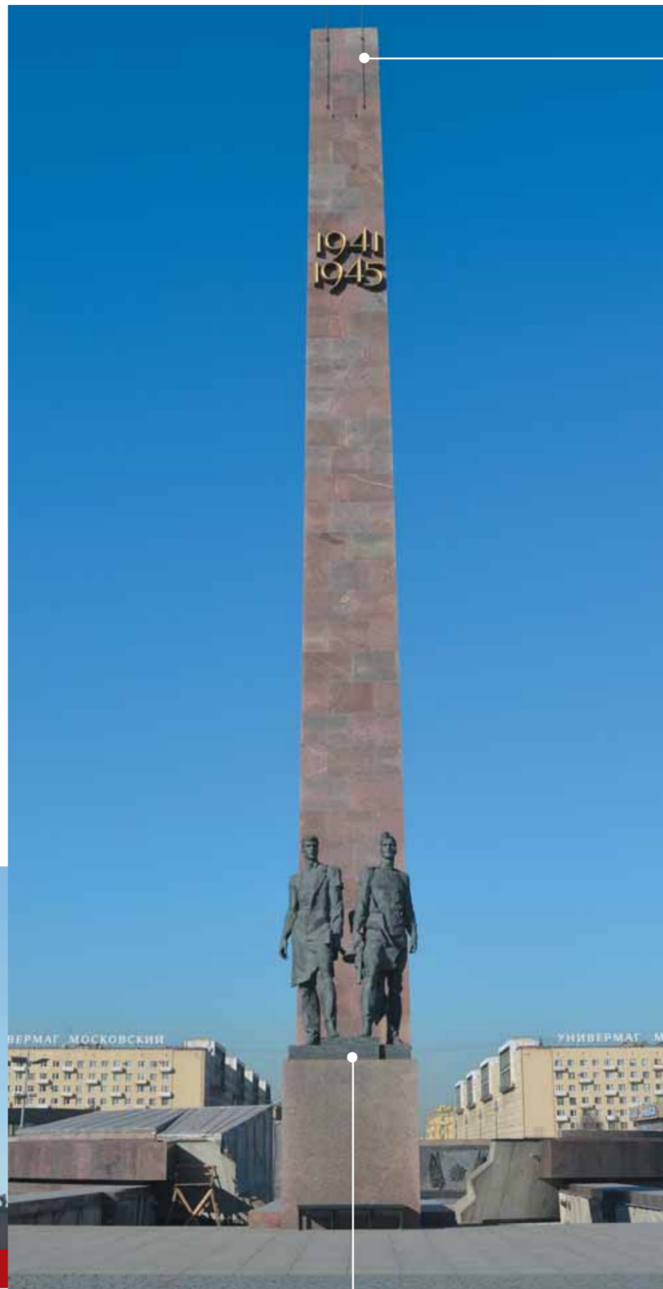
Гранитный обелиск и скульптурная группа «Победители»

Многофигурные скульптурные композиции «Солдаты», «Летчики и моряки», «Трудовой фронт», «На окопах», «Ополченцы», «Народные мстители (снайперы)» иллюстрируют жизнь в осажденном городе.