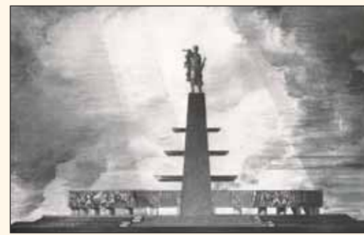
Конкурсный проект монумента Победы. Всесоюзный конкурс. Первая премия. 1958 г.