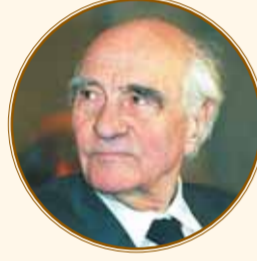
Скульптор Михаил Константинович Аникушин