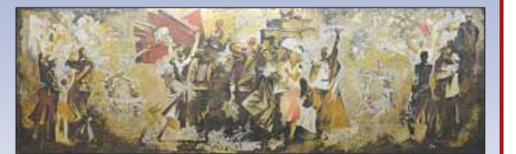
Зал украшен двумя мозаиками — «Блокада» и «Победа» размером 13,5x4,16 метра.

Авторы С.Н. Репин, И.Г. Уралов, Н.П. Фомин, руководитель А.А. Мыльников.