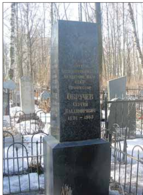
Захоронение С.В. Обручева