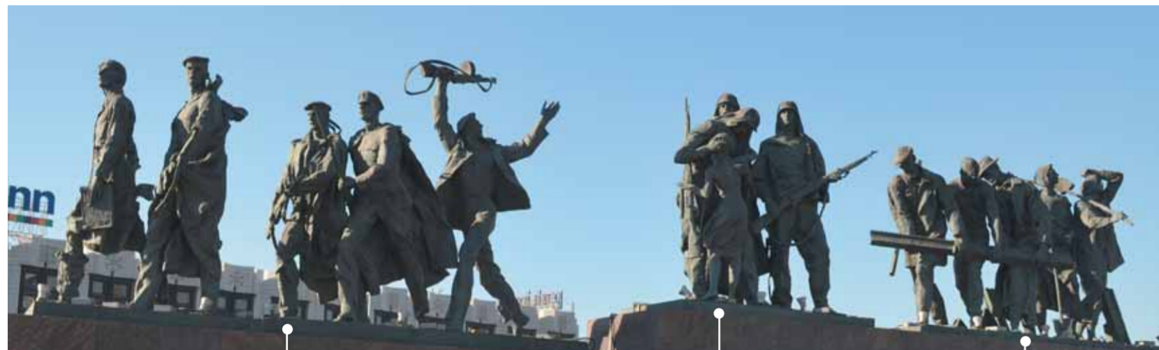
«Летчики и моряки»