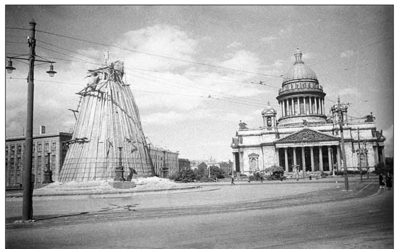
Во время блокады памятник был закамouflирован, фото 1942 года