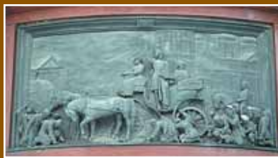
Холерный бунт 1831 года на Сенной площади