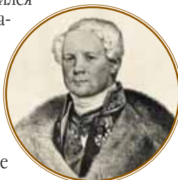
Архитектор Огюст Монферран