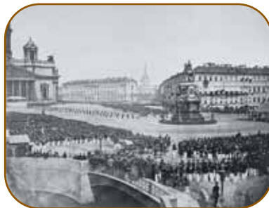
Торжественное открытие памятника. 7 июля 1859 года