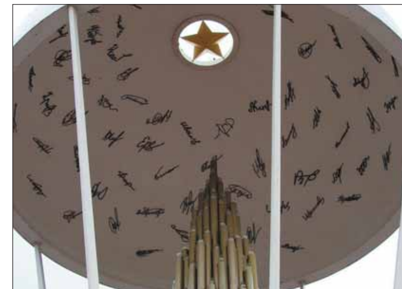
Под куполом памятника 6-й роты в Пскове вверх устремлено 84 свечи — по числу погибших десантников, а внутри купола — точные копии их подписей

18 марта «груз 200» на Московский вокзал отправилось встречать полпоселка, вторая половина ждала до поздней ночи в помещении клуба. Один из районных бизнесменов выделил машину — военкомат по закону не имел права предоставлять транспорт погибшим рядовым. Единственное, что сразу получили родители — непонятные пять тысяч рублей прямо на вокзал из рук какого-то офицера. Чуть позже за счет Ми-