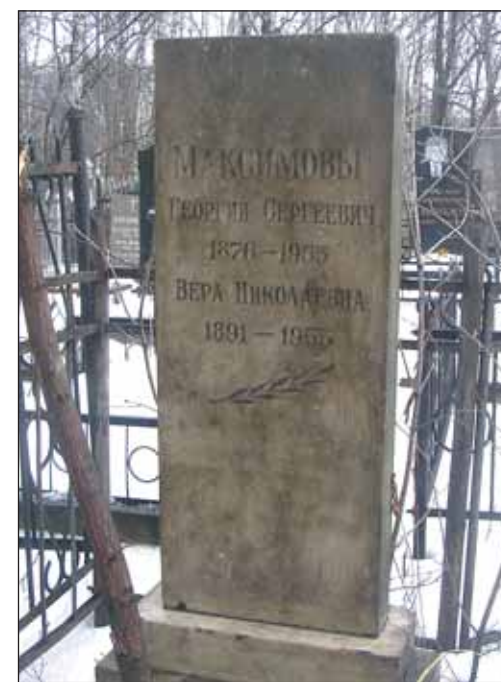
Захоронение Г.С. Максимова