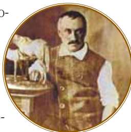
Скульптор Петр Карлович Клодт