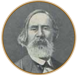
Скульптор Роберт Карлович Залеман