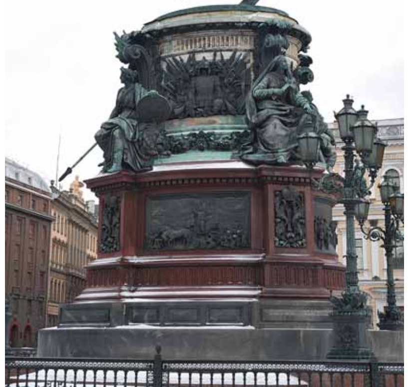
Общая высота памятника — 16,3 метра, и сегодня он является одним из самых высоких в Санкт-Петербурге

Памятник Николаю I и Медный всадник стоят на одной оси, разделенные Исаакиевским собором, причем Медный всадник повернут к памятнику Николаю спиной. Так зародилась эпитафия: «Дурак умного догоняет, да Исаакий мешает».