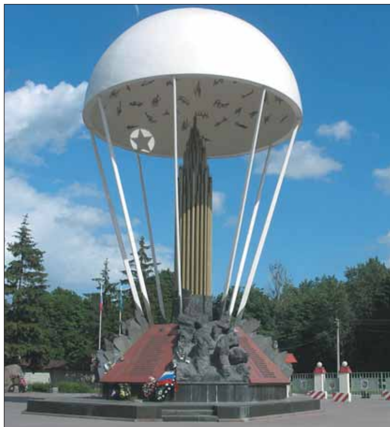
Памятник погибшим бойцам 6-й роты 104-го полка 76-й гвардейской Псковской дивизии ВДВ

В том сводном отряде псковских десантников были представители 35 республик, краев и областей России. Два наших региона — Петербург и Ленинградская область — понесли самые большие потери.