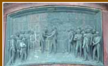
Награждение М.М. Сперанского, собравшего и издавшего в 1832 г. «Свод законов Российской империи»