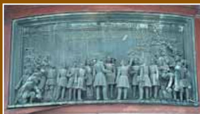
Открытие императором Веребьинского моста Петербург-Московской железной дороги в 1851 г.