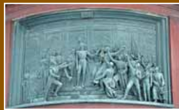
Восстание декабристов в 1825 году

Четыре барельефа на пьедестале запечатлели главные исторические события, которыми, по мнению современников, отмечено правление императора