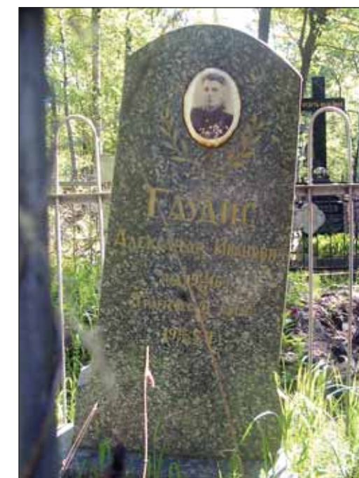
Захоронение А.И. Гаудиса