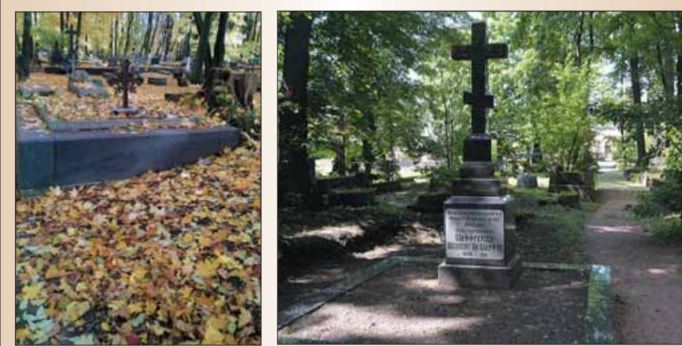
Захоронение Николая Константиновича Шаффаузуна-Шенберг-эк-Шауфуса (1846—1911).

Начальник Николаевской ж/д (1899—1905), министр путей сообщения (1906—1909). Генерал-лейтенант. По образованию — военный инженер, выпускник Николаевской инженерной академии. Служил в обществах Рязано-Козловской, Курско-Киевской ж/д (управляющий). Позднее — директор Московско-Курской ж/д, начальник Московско-Нижегородской и Муромской ж/д. Был попечителем Тульского и Петербургского железнодорожных училищ.