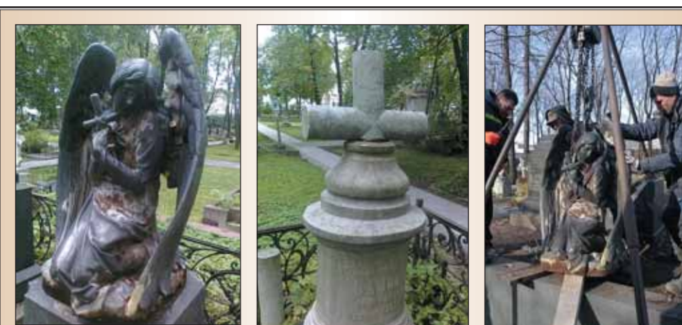
Семейное захоронение семьи Саловых.

В 1830-х годах Управление водных и сухопутных сообщений (создан в 1809 году) получило название «Главное управление путей сообщения и публичных зданий» (ГУПС и ПЗ).