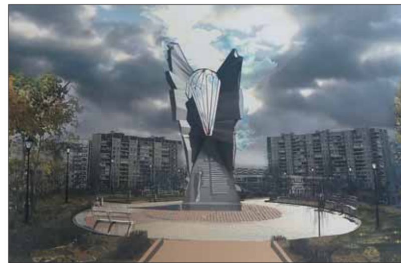
Проект скульптора Николая Гордиевского

В ночь с 29 февраля на 1 марта 2000 года в жестоком неравном бою с чеченскими боевиками полегла 6-я рота 2-го батальона 104-го парашютно-десантного полка 76-й гвардейской Псковской дивизии ВДВ. Бойцы предотвратили прорыв 2,5 тысячи боевиков Хаттаба, которые пытались вырваться из окружения, уничтожили свыше