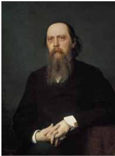
И.Н. Крамской. Портрет М.Е. Салтыкова-Щедрина. 1879 г.

Получив писательскую известность, Салтыков-Щедрин в 1862 году пытается уйти с государственной службы и связать свою жизнь с литературой. После непродолжительной работы в штате журнала «Современник» он заявляет, что «труд литератора может привести только к голодной смерти», и возвращается на государственную службу. Окончательно уходит в отставку уже в 1868 году и начинает работать в «Отечественных записках». Через два года выходит,