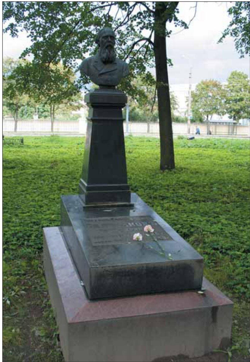
Литературские мостки Волковского кладбища

Имена или прозвища глуповских градоначальников стали нарицательными, а их черты свойственны многим чиновникам в истории России. Путешественник по городскому выгону Фердыщенко, «Органчик» Брудастый, сочинитель проектов Бородавкин, ужасный Угрюм-Бурчеев с его «Идет