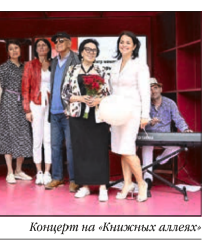
Концерт на «Книжных аллеях»

На сайте www.pamyatbeskonечna.ru регулярно публикуются интервью с психологами, специализирующимися на вопросах проживания горя и утраты. Статьи наполнены практическими рекомендациями, полезными и специалистам, и обычным читателям.