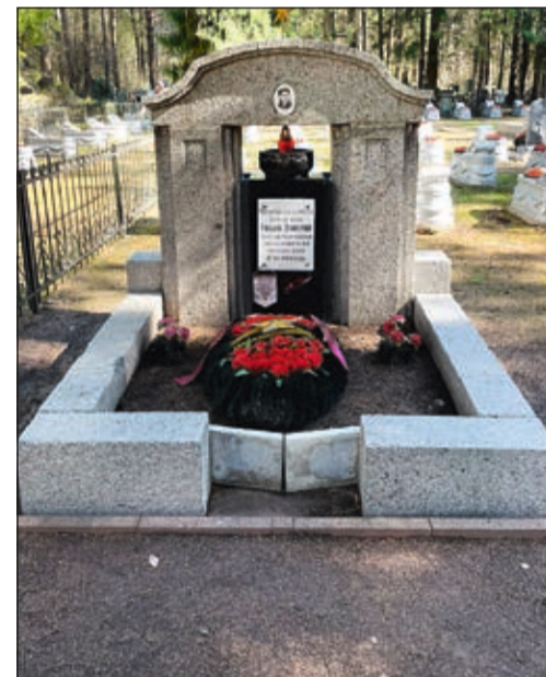
Уход за могилами Героев Советского Союза на Северном (ООО «СИЭМ») и Сестрорецком (ООО «Собор») кладбищах (слева направо)

Все эти работы проводятся регулярно в течение года, но есть в нашем календаре особо важные исторические даты, к которым состояние мемориалов должно быть практически идеальным. Один из таких дней — День Победы советского народа в Великой Отечественной войне. В этом году мы отмечаем 79-ю годовщину этого великого события, и компании, отвечающие за состоянием мемориальных захоронений, подготовились к празднику достойно.