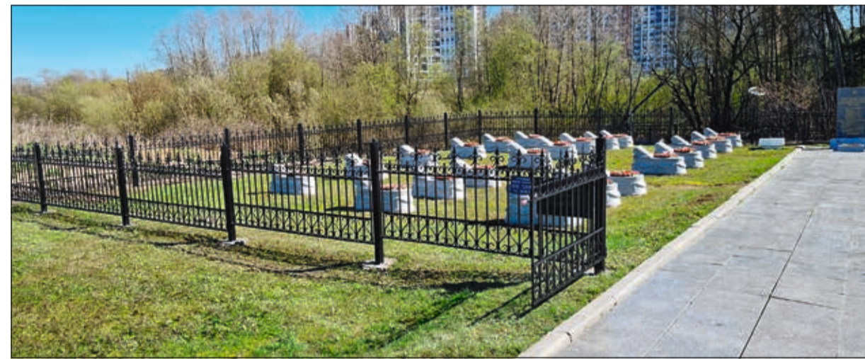
ООО «СИЭМ» осуществляет работы по благоустройству воинских братских захоронений на воинском кладбище «Каменка» и на Северном кладбище (слева направо)