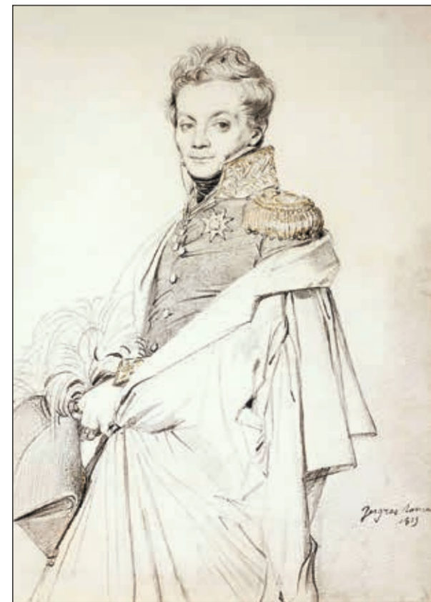
Портрет русского генерала Хитрово. Ж.О.Д. Энгер

Николая Фёдоровича спасла спешная распродажа имущества, среди которого было много ценных и редких вещей: гравюры,