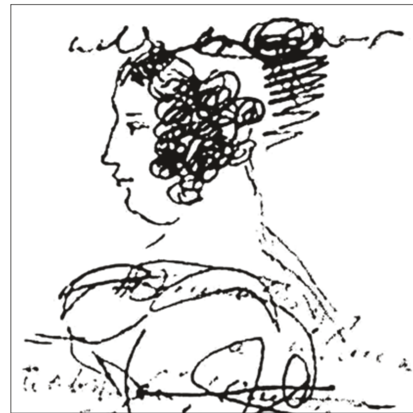
Елизавета Хитрово на рисунке А.С. Пушкина

Она исправно снабжала поэта новостями о культурной жизни Европы, литературными новинками и новостями о политических событиях. Пушкин писал: «Возвратившись в Москву, сударыня, нашла у княгини Долгорукой пакет от Вас, — французские газеты и трагедию Дюма, — всё это было новостью для меня...»