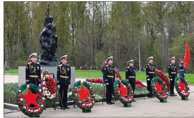
За состоянием воинского братского захоронения на Большеохтинском кладбище следит ООО «РИТЭК»

К руглый год компании, входящие в Ассоциацию предприятий похоронной отрасли Санкт-Петербурга и Северо-Западного региона, осуществляют уход за могилами Героев Советского Союза и полных кавалеров ордена Славы, а также за воинскими братскими захоронениями, находящимися на кладбищах, на которых они отвечают за предоставление погребальных услуг и благоустройство.