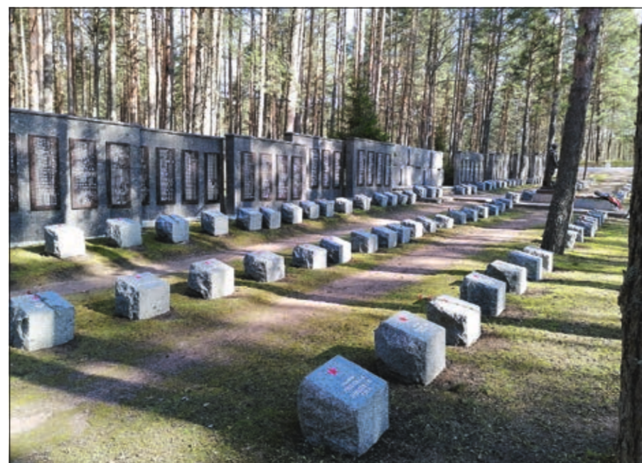
ООО «Собор» поддерживает в порядке воинские братские захоронения на Зеленогорском, Песочинском и Сестрорецком мемориальном кладбищах (слева направо)