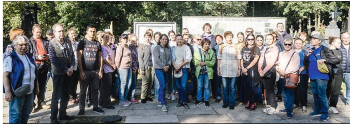
Субботник на Смоленском кладбище

Рекомендации наших психологов легли в основу брошюры для людей, проживающих утрату. Эти материалы были изданы Центром и распространяются бесплатно для всех, кто в них нуждается.