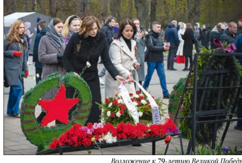
Возложение к 79-летию Великой Победы

Материал подготовлен Центром мемориальной культуры «ПАМЯТЬ БЕСКОНЕЧНА» www.pamyatbeskonечna.ru