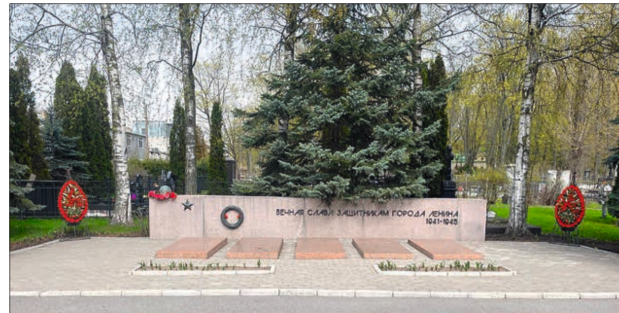
Благоустройство на воинском братском захоронении на Волковском православном кладбище производит ООО «Оникс»