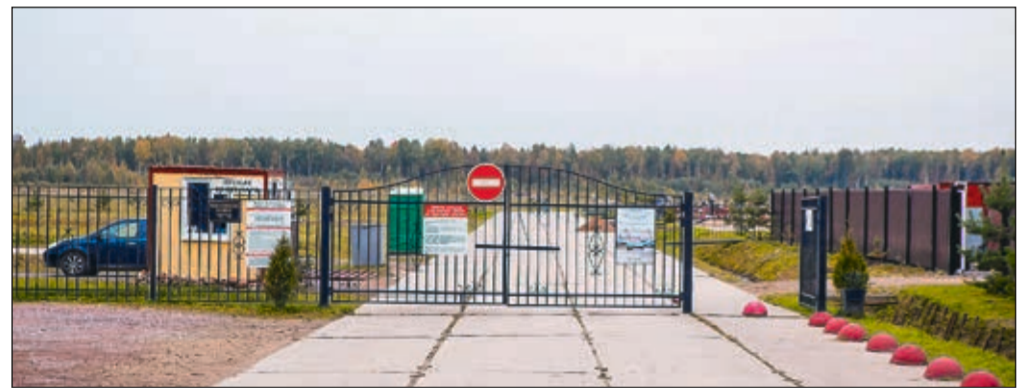
НОВОЕ КОЛПИНСКОЕ КЛАДБИЩЕ (г. Колпино, ул. Понтонная), тел. +7 (911) 921-43-64.