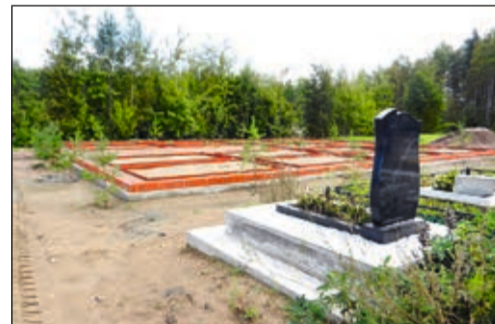
КОВАЛЁВСКОЕ КЛАДБИЩЕ (Всеволожский район, платформа Ковалёво), тел. +7 (812) 956-07-74.

В настоящее время в Санкт-Петербурге действуют 3 кладбища, на которых производятся захоронения на свободное место: