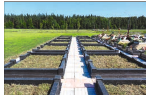
БЕЛООСТРОВСКОЕ КЛАДБИЩЕ (Курортный район, пос. Песочный, Белоостровское ш., строение 1, 2), тел.: +7 (812) 320-88-05, +7 (812) 320-88-06.