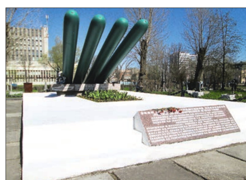
Мемориал экипажу подводной лодки «Щ-323». Силами ООО «Собор», которое выполняет работы по уходу за захоронениями на кладбище «Остров Декабристов», братская могила моряков была отреставрирована. Монумент очищен от старой краски, проведена грунтовка и покраска торцев, осуществлены ремонт бетонного основания, обновление знаков, выравнивание плит вокруг памятника.

В 1955 году в ЦКБ-18 (ныне ЦКБ МТ «Рубин») была разработана