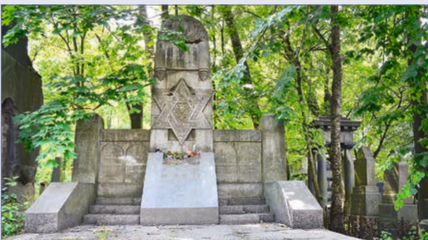
Захоронение скульптора М.М. Антокольского

В 1898 году вокруг кладбища была возведена кирпичная стена, крытая черепицей. Были проложены дорожки, выкопаны дренажные канавы, устроены мостики. В сентябре 1908 года был залож