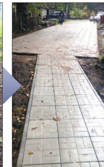
Укладка плитки на Невской дорожке