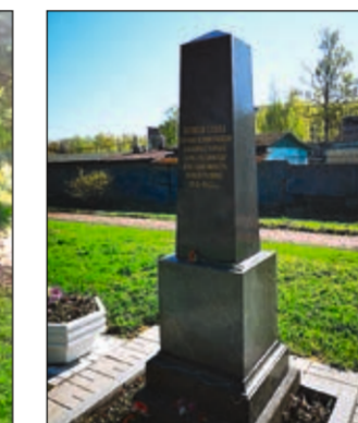
Уход за воинскими захоронениями