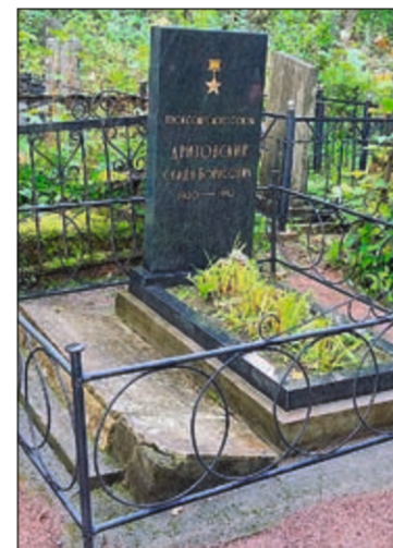
Захоронение Героя Советского Союза С.Б. Дризовского было полностью восстановлено за счет ООО «Ритуал» в 2015 г.