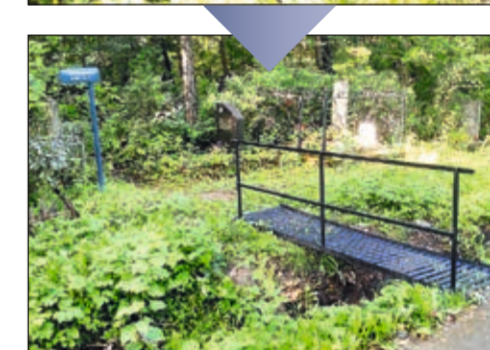
Установка новых мостиков через дренажные каналы