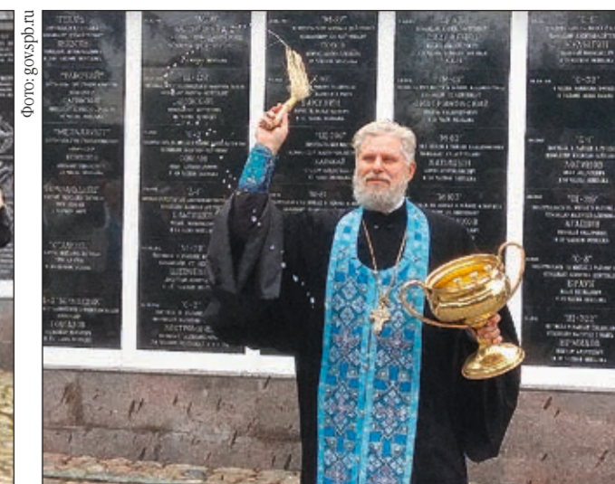
В 2009 году в Сестрорецке рядом с главным храмом подводного флота России — храмом святых первоверховных апостолов Петра и Павла — была открыта Стена памяти — мемориальный комплекс, посвященный погибшим морякам-подводникам, начиная с 1904 года до наших дней. В 2018 году в соответствии с планом реализации гранта президента России завершена полная реконструкция Стены памяти. Активное участие в работе приняло ООО «Аэра» — компания, входящая в Ассоциацию предприятий похоронной отрасли Санкт-Петербурга и Северо-Западного региона. Компанией были изготовлены 138 новых мемориальных досок, в том числе 24 — на безвозмездной основе.