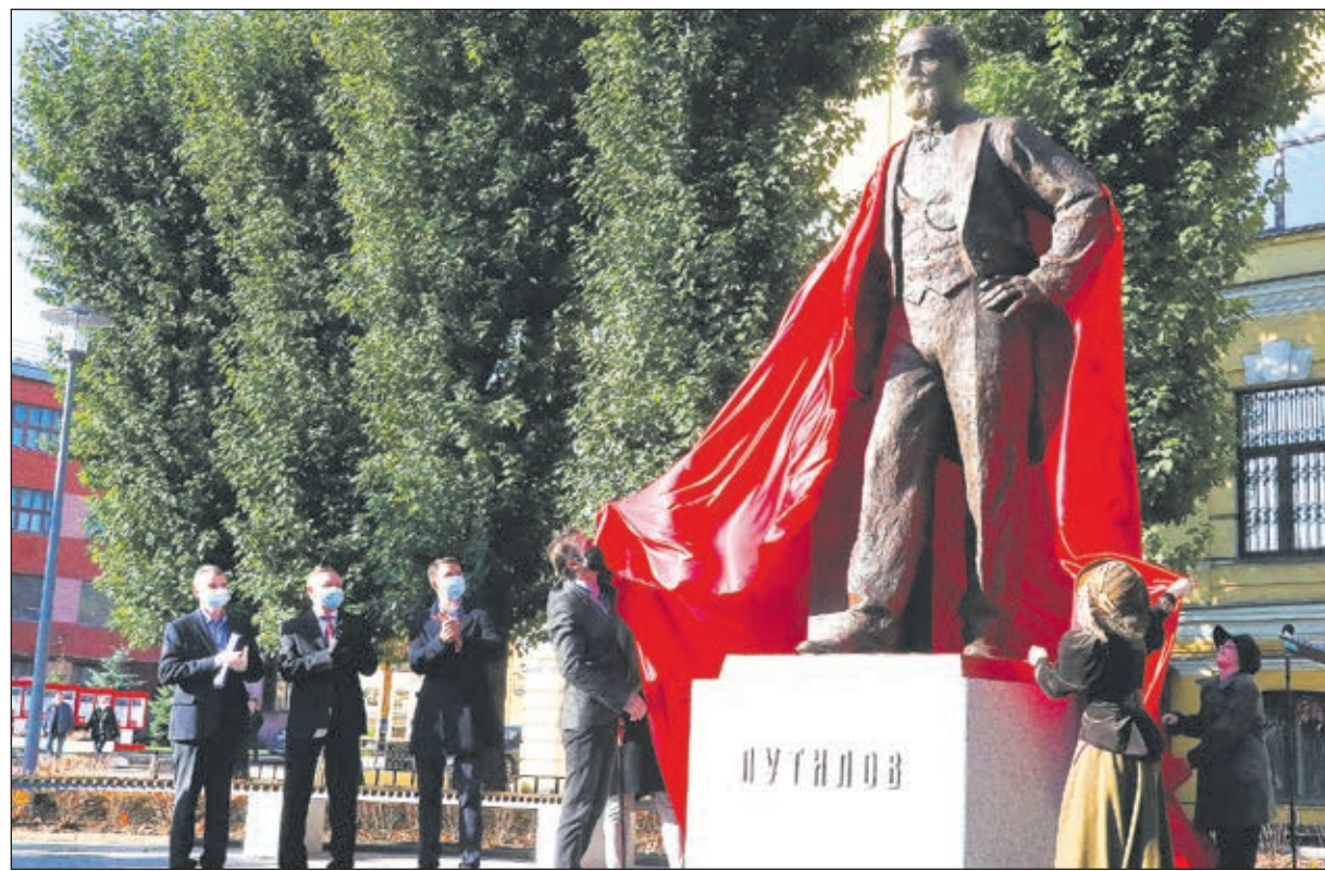
В XX веке завод был дважды переименован: сначала получил название Красный путиловец, за-

В 1868 году Николай Путилов купил на окраине города разоренный завод и превратил его в процветающее металлургическое предприятие. Оно стало основным поставщиком рельсов для отечественных железных дорог, позже — боеприпасов, вагонов, пушек, инструментов и других видов промышленной продукции.