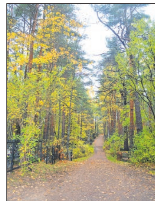
Межквартиральная набивная дорожка