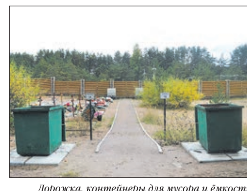
Дорожка, контейнеры для мусора и ёмкости для технической воды на новых участках