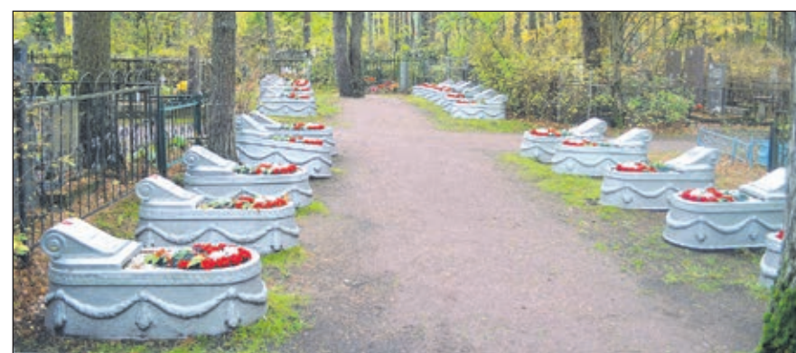
Воинское братское захоронение