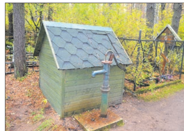
Ручной скважинный насос на колодце с технической водой