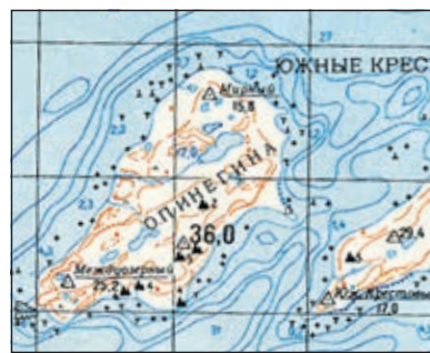
Остров Пинегина в группе островов Южные Крестовые около западного побережья Новой Земли