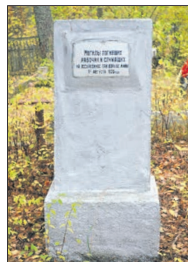
Памятник на братском захоронении рабочих и служащих Сестрорецкого оружейного завода, погибших на воскресенье по заготовке дров 1 августа 1920 года