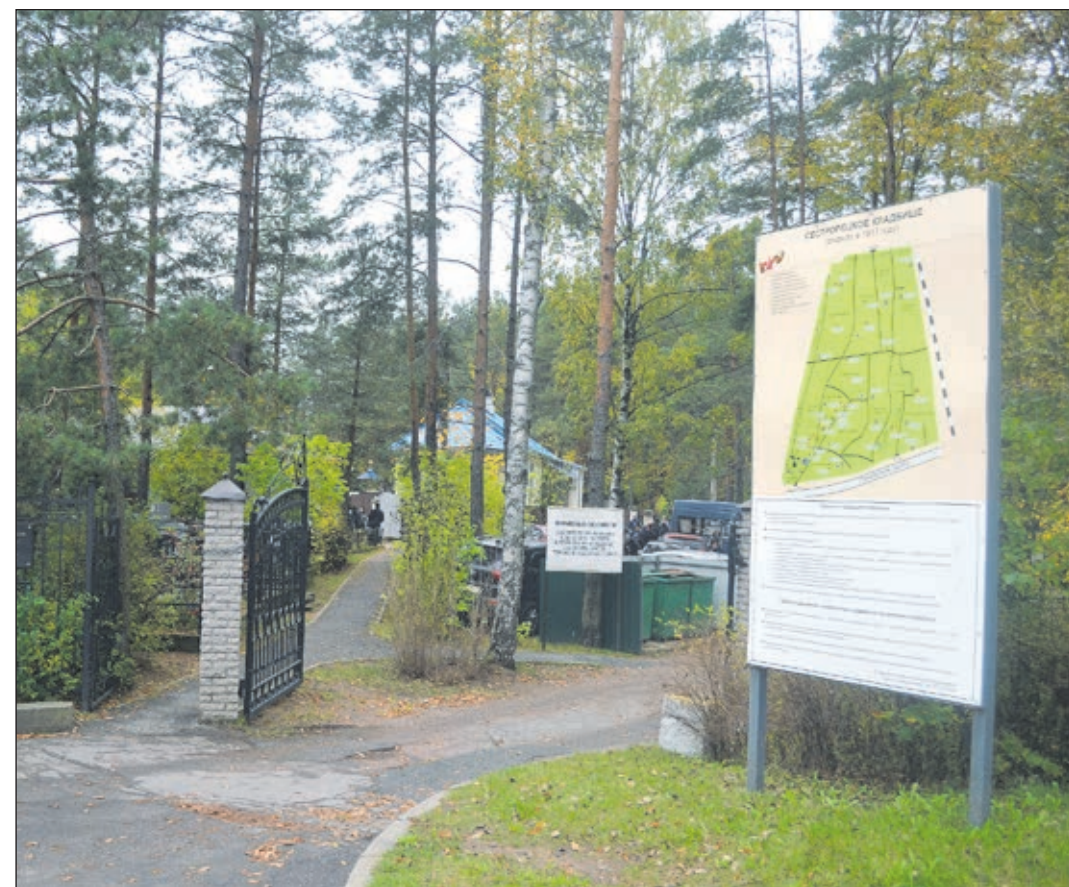
Центральный вход и новый информационный стенд