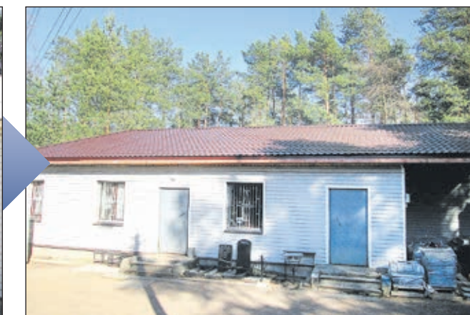
Ремонт кровли на здании административно-бытового комплекса