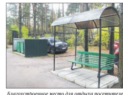
Благоустроенное место для отдыха посетителей и площадка для мусорных контейнеров