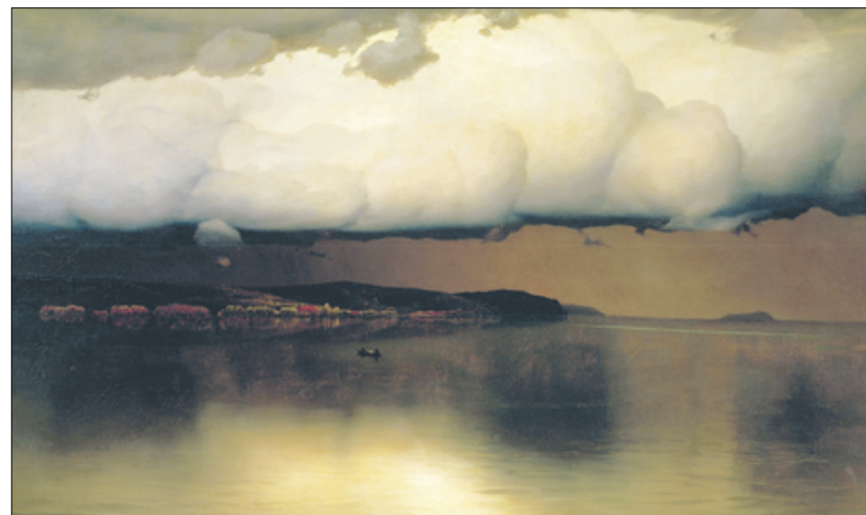
Н.Н. Дубовской. «Притихло» (1890 г.). Русский музей, повторение — в Третьяковской галерее

В 1930-х годах вновь задумались о необходимости создания в Новочеркасске художественного музея, но помешала уже Великая Отечественная война. После войны коллекцию картин Дубовского