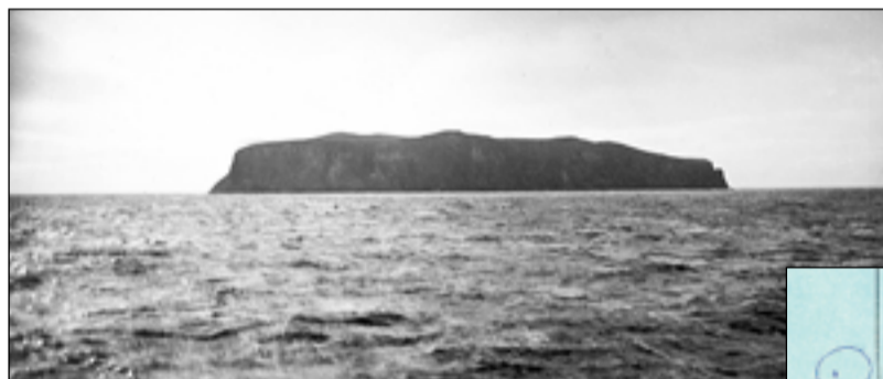
Остров Вилькицкого в архипелаге Де-Лонга