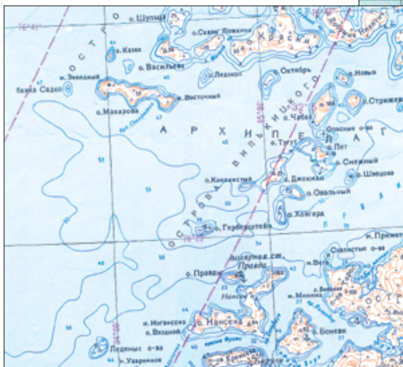
Архипелаг Вилькицкого в Карском море