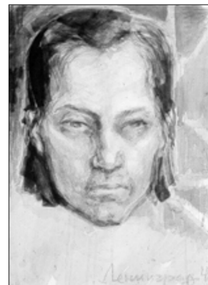
Автопортрет «Перед смертью», февраль 1942 г.