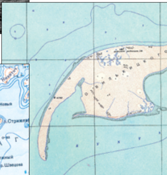
Остров Вилькицкого в Енисейском заливе

графических исследований, в том числе и арктических.