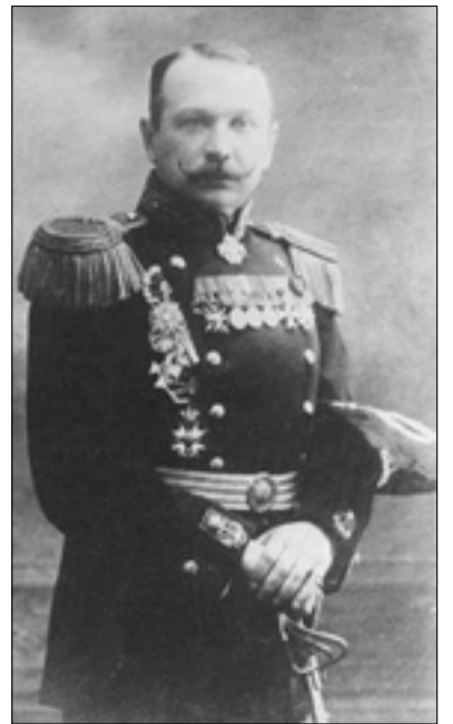
поездом №97...» Смерть застала адмирала на боевом посту.