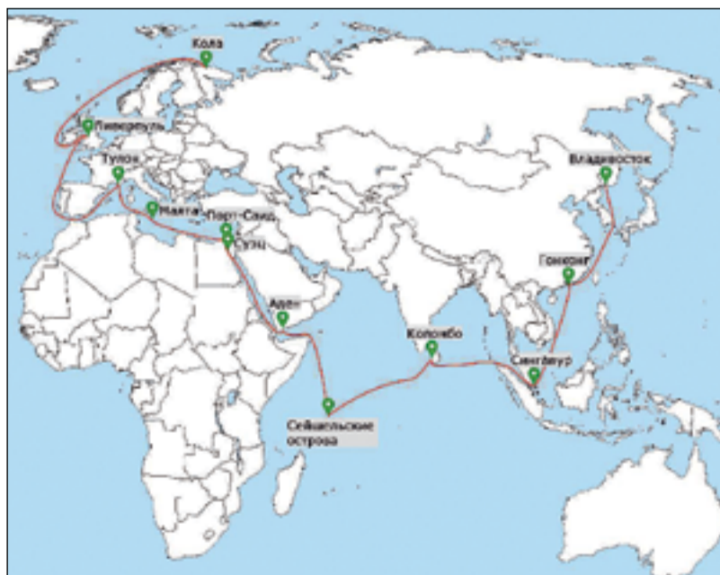
Схема перехода российских кораблей из Владивостока в Петроград