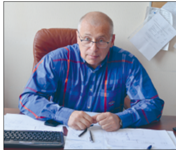
Окончание. Начало на стр. 1

Большая часть гробов поступает в продажу именно в нашем городе. Эту продукцию предприятия — от недорогих «бюджетных» вариантов до элитных — можно увидеть во всех магазинах ритуальных принадлежностей. Часть изделий поступает в Ленинградскую область. Но есть поставки и в другие города региона — как правило, за пределами Петербурга продаются гробы высокой ценовой категории.