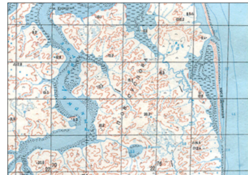
Полуостров Суслова на восточном побережье Таймыра