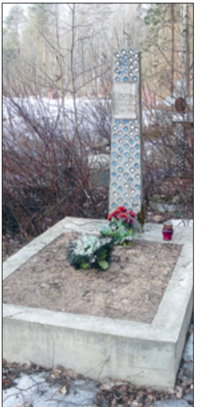
Захоронение И.М. Суслова на Северном кладбище

В 1935 году Иннокентий Суслов был назначен заместителем начальника Гидрографического управления Северного морского пути, в 1938 году возглавил Музей