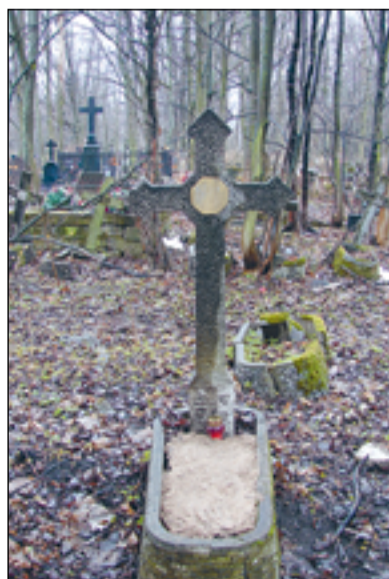
Захоронение Е.Л. Коринфского на Смоленском православном кладбище