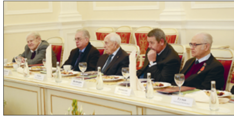
году 800-летию Александра Невского.

Губернатор сообщил, что президент России Владимир Путин подписал указ о праздновании юбилея. Создан оргкомитет по подготовке к торжествам.